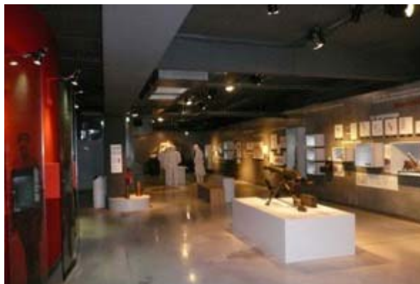
Centre d'Interprétation Marne 14-18

Afin d'apporter plus de visibilité aux musées (musée de la Bertaube qui reste méconnu par exemple), le Conseil suggère que des actions soient menées afin de proposer des scénographies plus vivantes, ayant davantage d'interactivité avec le public (démonstrations à l'instar de ce qui se fait au Centre d'Interprétation Marne 14-18 de Suippes, etc.).