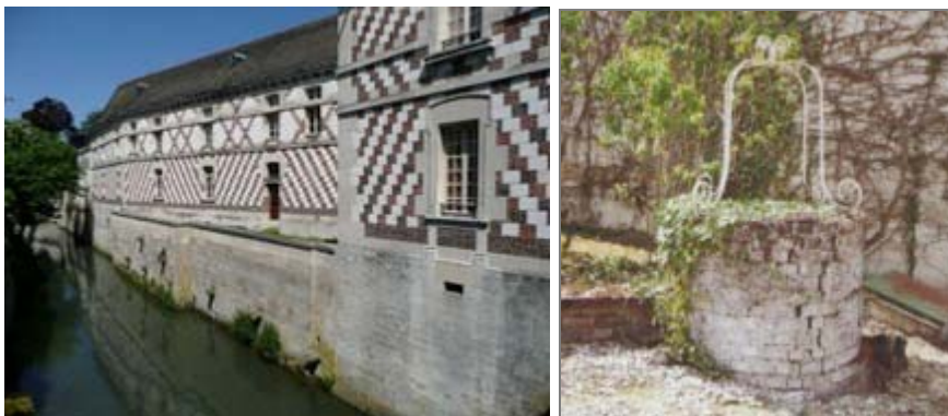
Couvent Sainte-Marie à Châlons-en-Champagne