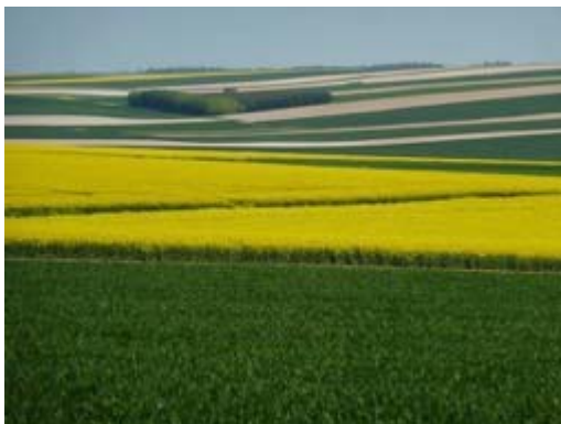
Plaine agricole de la Champagne Crayeuse